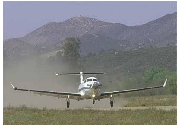
Pilatus PC-12