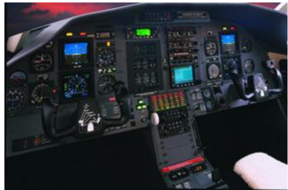
PC-12 Cockpit

Bei allen Bewerbungen als freiwilliger Flugzeugführer (Volunteer Pilot) wird individuell nach Erfahrung und Leistung entschieden.